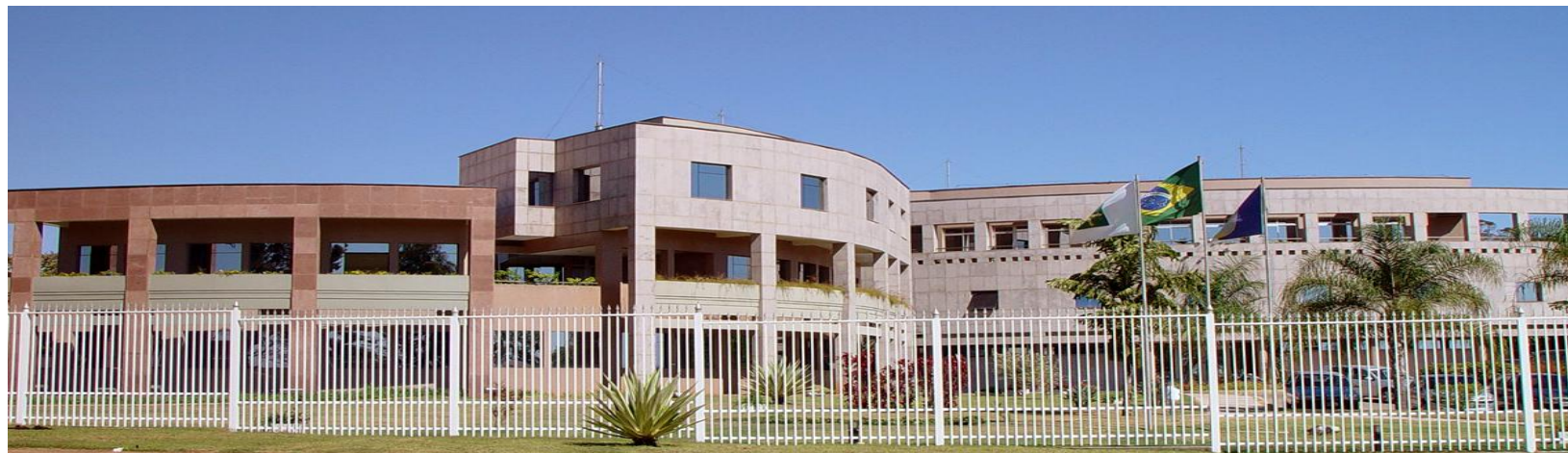
Representação BID no Brasil