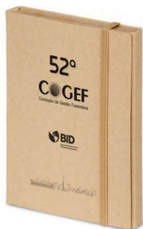
52º Cogef // Peças gráficas Caneta Área Impressão: 4x1cm